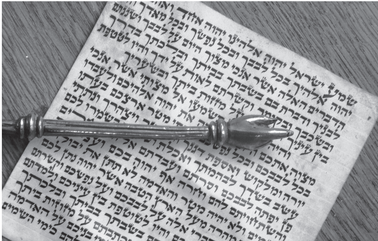
Het Sjema op perkament, tekst uit een mezoeza

den het is volbracht verzuchtte, hebben wij niet gehoord. Onze menselijke stem, gedragen door onze ademtocht, kan in overgeleverde taal nooit beschreven worden. In het spreken draagt zij die taal nu juist. Tegelijkertijd is de taal haar woning. Daar is zij op aangewezen, die stem van ons. De stem woont in de taal, terwijl zij tegelijkertijd onderdak aan de woorden geeft. Het is de stem die kleur geeft aan de woorden, die door de ademtocht cadans aanbrengt, woorden leven inblaast. Niets is zo onvervangbaar als de stem. Dat zeggen we ook: ik wil nog even je stem horen . Nog even verkeren we in die eigenste nabijheid die met geen pen te beschrijven is en die nergens, door niemand, toegeëigend kan worden. Het is die stem waarop ieder beeld stukslaat. In het horen schuilt de geborgenheid , zegt Martin Heidegger. Vandaar ook dat er niets zo sterk is als de orale traditie.